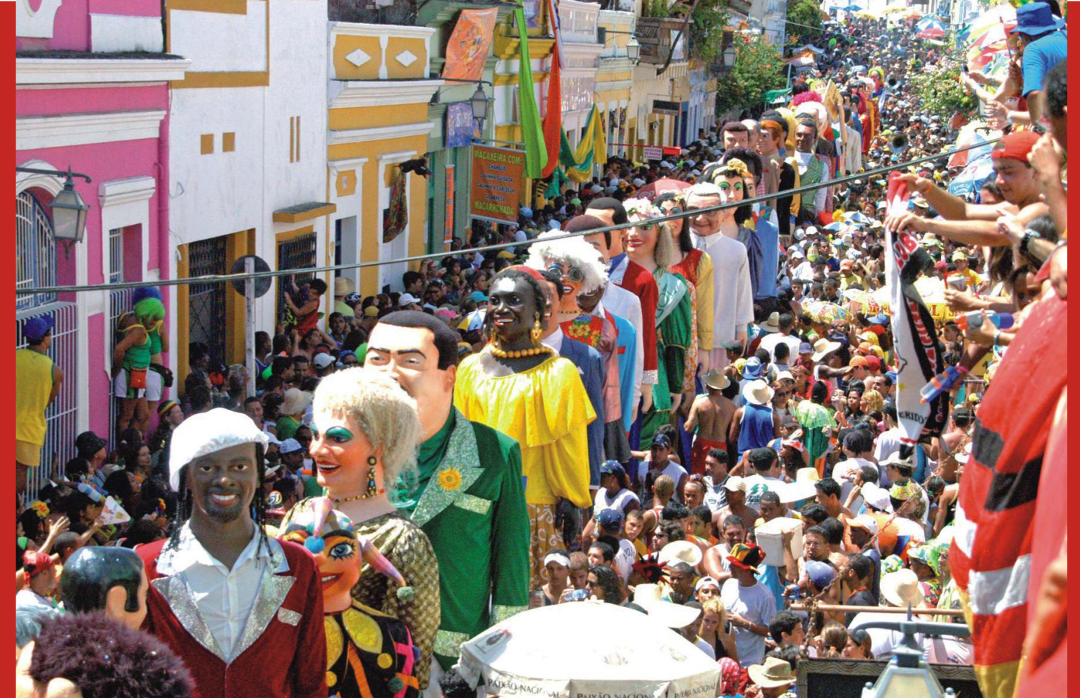
Bonecos gigantes. Olinda, 2006.