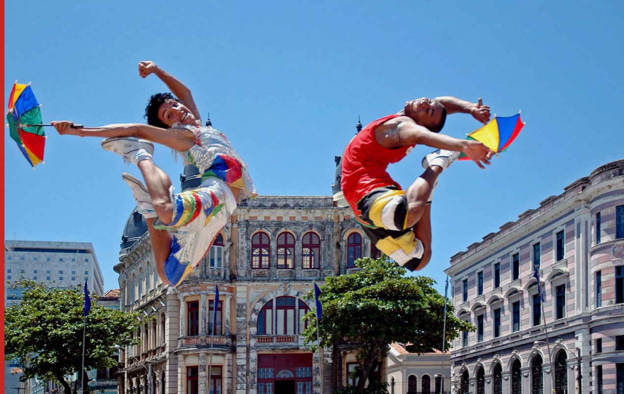
Passistas de frevo. Marco Zero. Recife, 2010.