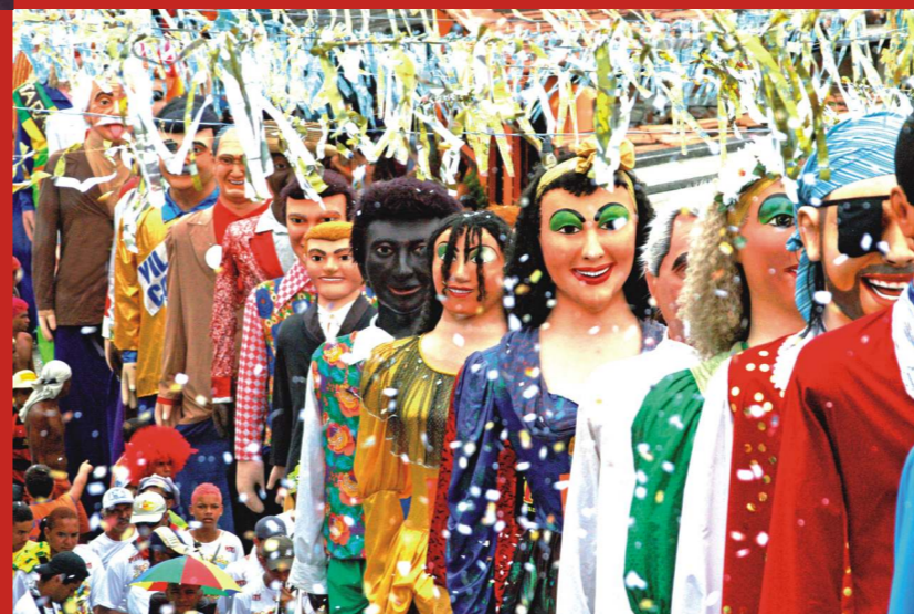
Bonecos gigantes no Carnaval de Olinda, 2006.

O Frevo ocorre também em outras cidades do Brasil: Brasília-DF, Campina Grande-PB, João Pessoa-PB, Maceió-AL, Rio de Janeiro-RJ, São Paulo-SP e muitas outras, como Salvador-BA, onde uma nova forma de Frevo foi criada.