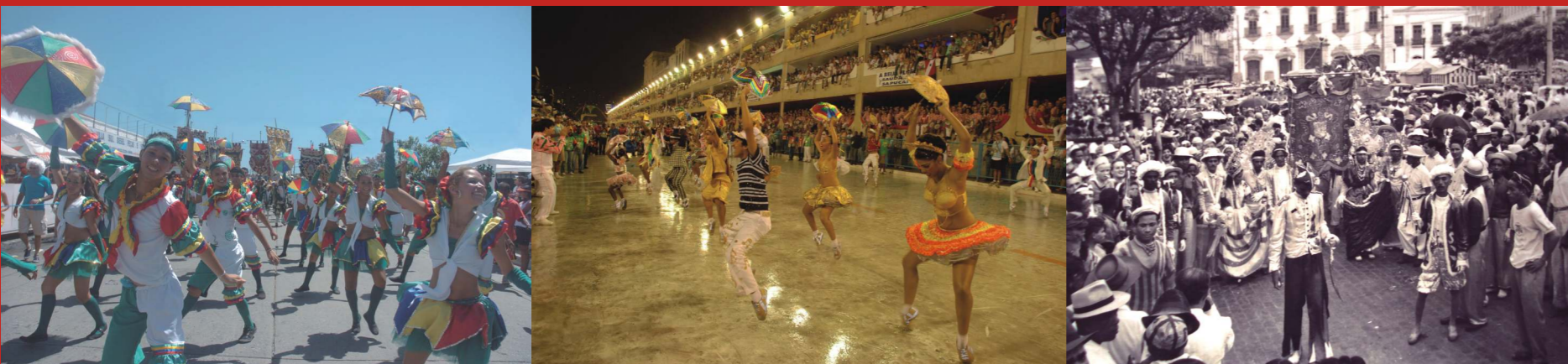
Troça Carnavalesca Mista; Passistas do Frevo compoendo a Comissão de Frente da Mangueira, no desfile das escolas de samba do Rio de Janeiro, 2008. Acervo Prefeitura do Recife; e Foliões do Clube Carnavalesco Misto Lavadeira de Areias, na Praça da Independência, 1957. Acervo Museu da Cidade do Recife