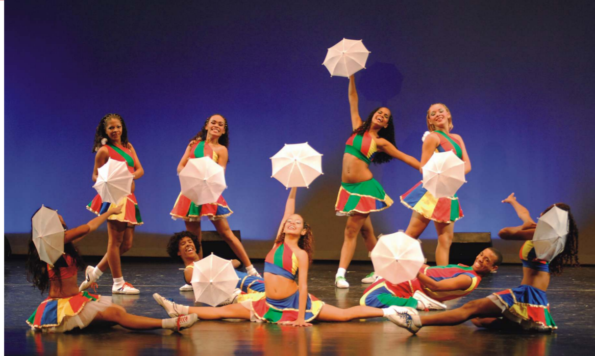
Alunos da Escola Municipal de Frevo. Recife, 2004. Acervo Escola Municipal de Frevo