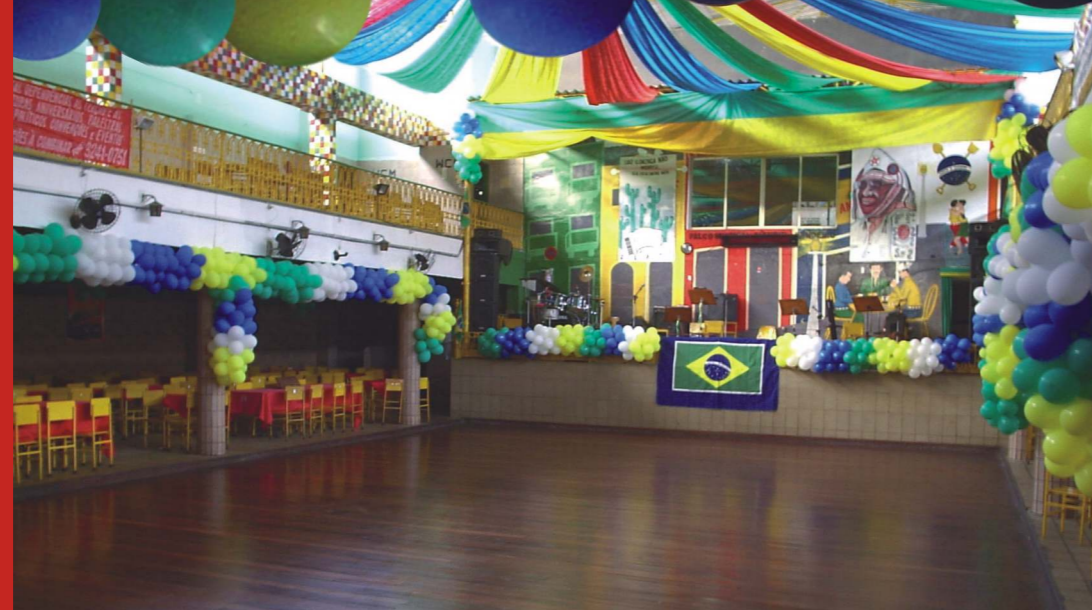
Sede do Clube Carnavalesco Misto Pás Douradas. Recife, 2006.