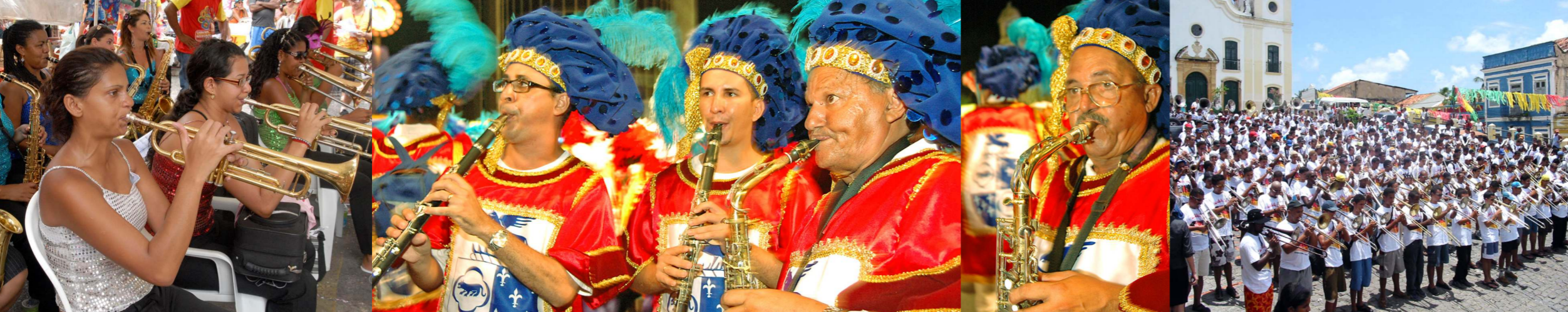
Orquestra feminina no Mercado da Boa Vista. Recife, 2008; Músicos do Bloco da Saudade. Recife, 2007.; e Orquestra no Largo do Amparo, 2004.