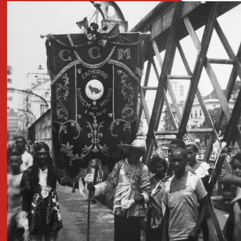
Foliões com estandarte do Clube Carnavalesco Misto «Cachorro do Homem do Miúdo» na Ponte da Boa Vista, Recife, 1957