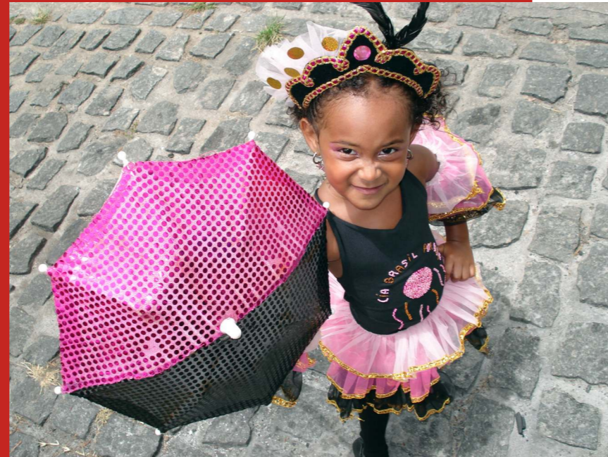
Passista mirim do Grupo de Passistas Adriana do Frevo. Olinda, 2006.