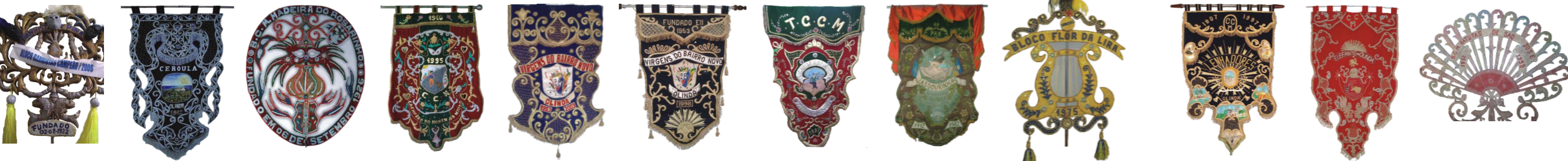
Estandartes e flabelos das agremiações do Frevo do Recife e de Olinda