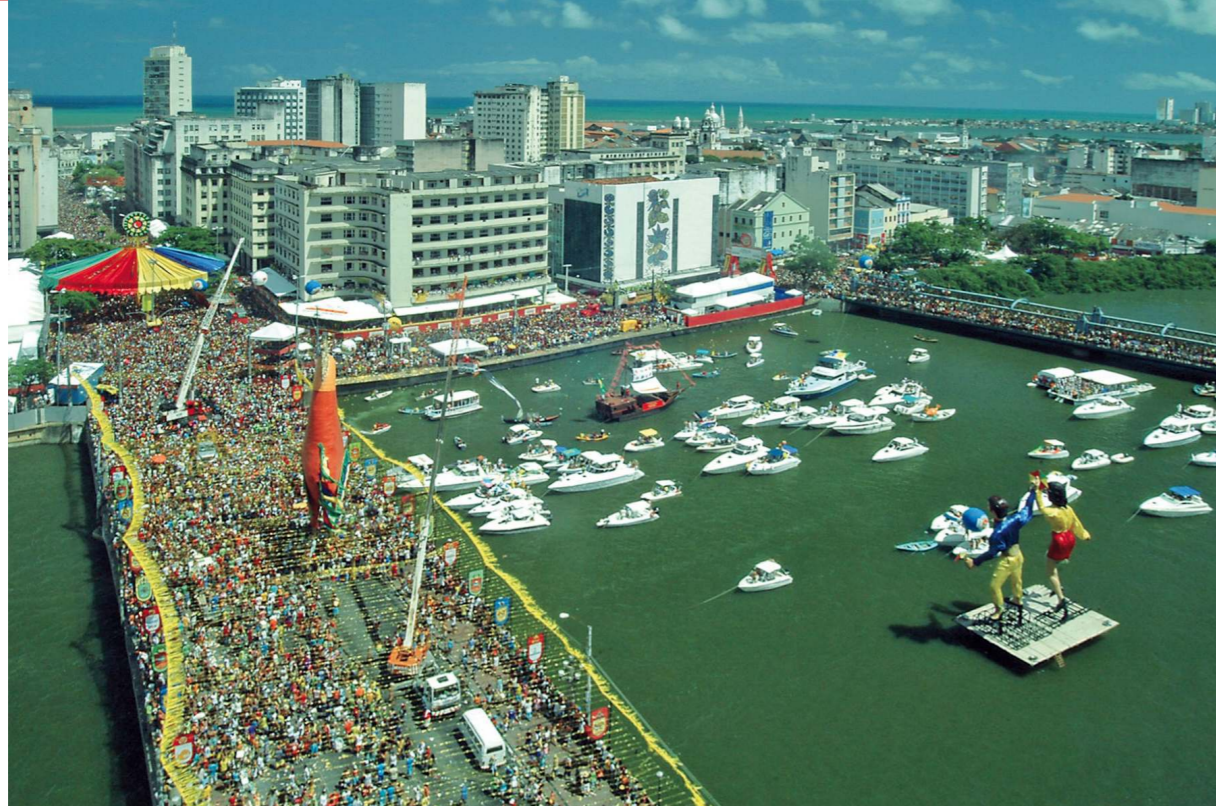
Desfile do clube carnavalesco O Galo da Madrugada. Recife, 2006