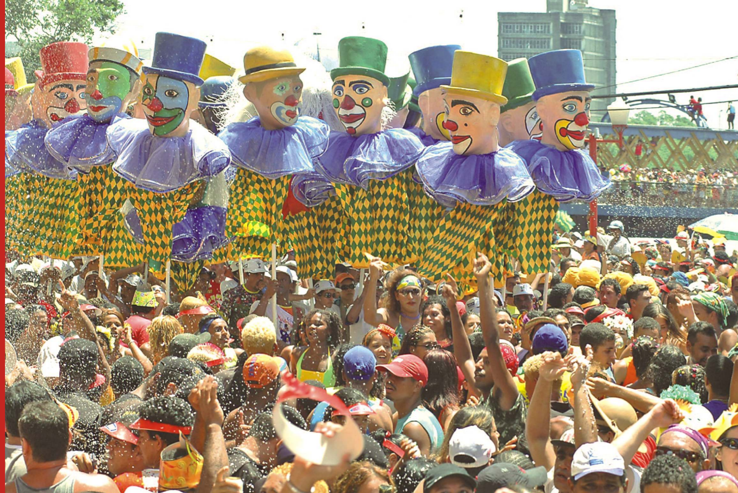
O Galo da Madrugada. Recife, 2006