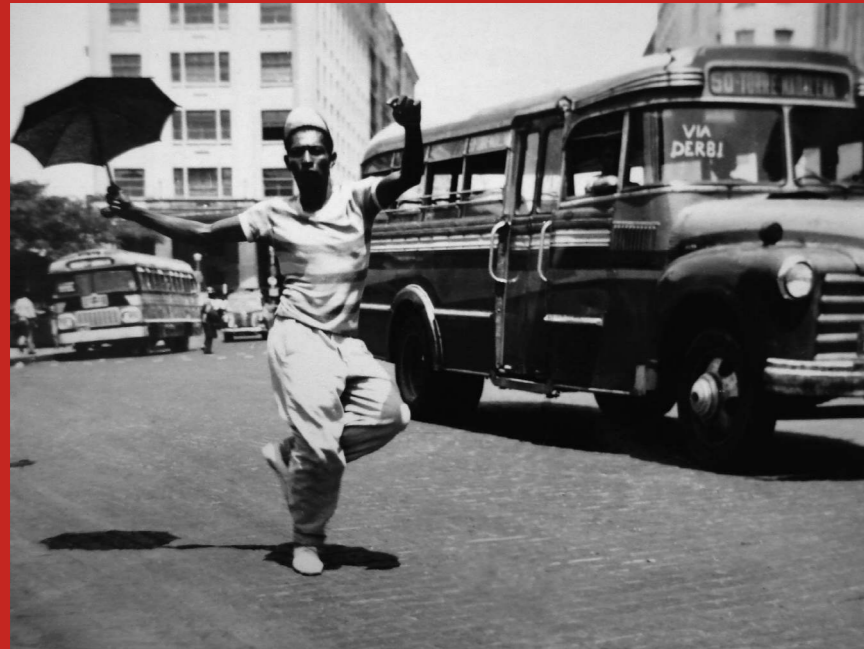
Passista na Praça da Independência. Recife, 1955.