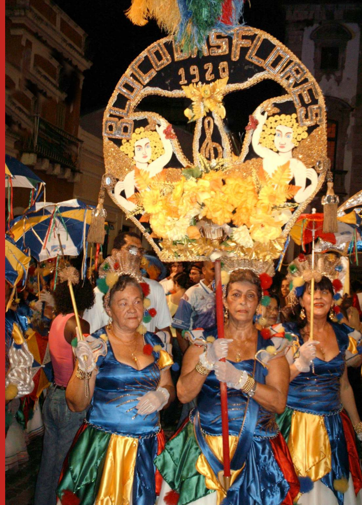
Integrantes do coral feminino do Bloco das Flores. Recife, 2006.