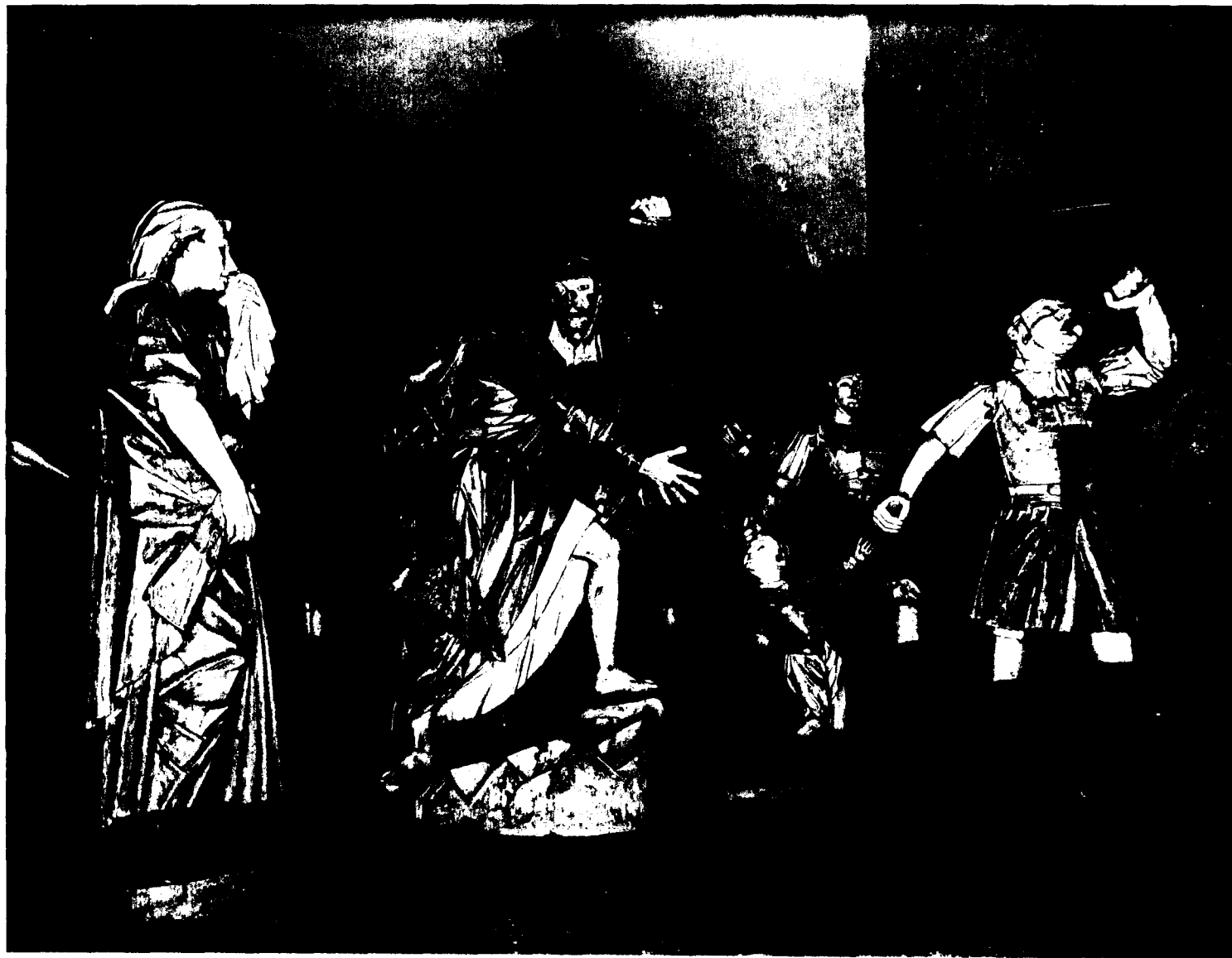
Bom Jesus do Matozinhos : ensemble du Portement de Croix.