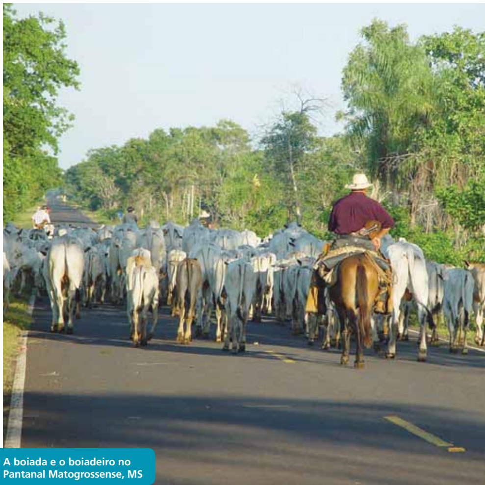
A boiada e o boiadeiro no Pantanal Matogrossense, MS