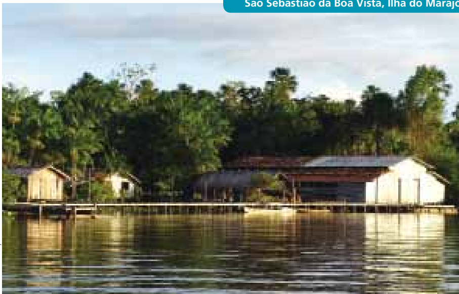
São Sebastião da Boa Vista, Ilha do Marajó, PA

O resultado e as ações propostas para as Paisagens Culturais Brasileiras variam de lugar para lugar, pois em cada contexto existe uma série de fatores específicos que devem ser considerados. A criação de museus, centros de interpretação ou casas de cultura, por exemplo, não é obrigatória, mas são algumas das ações possíveis de acontecer como decorrência da chancela.