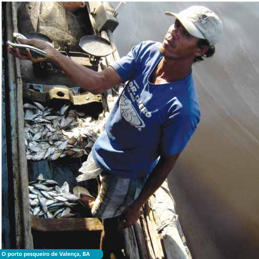
O porto pesqueiro de Valença, BA