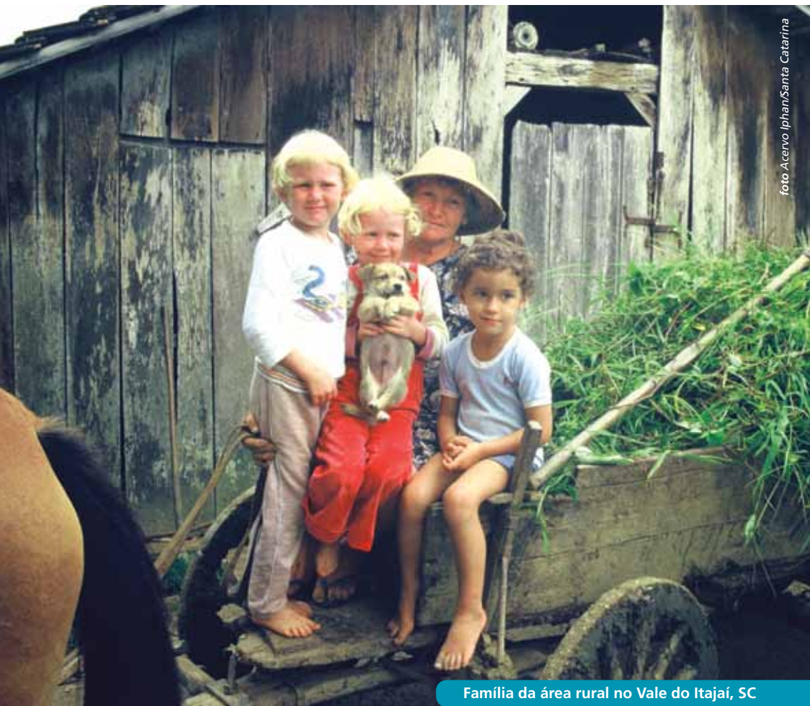
Família da área rural no Vale do Itajaí, SC