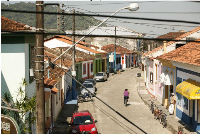
Figura 5 - Rua XV de Novembro, Iguape/SP.