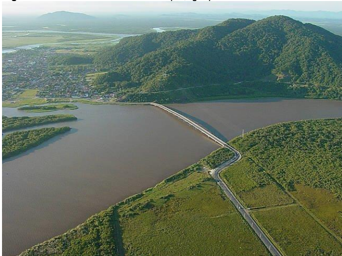
Figura 7 - Vista aérea do Morro da Espia, Iguape/SP.