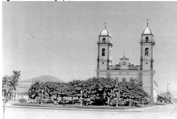
Figura 1 - Basílica de Iguape, s/d

Alguns anos depois, em 1968, após solicitação de um político local, Lucio Costa sugere a preservação de Iguape pelo Iphan. Mas neste momento, a decisão foi a de apoiar o tombamento em nível estadual. A estratégia adotada pelo Iphan foi a de fomentar a fundação de conselhos e instituições de preservação em nível estadual que pudessem dar conta das pressões sobre o patrimônio, como o crescimento urbano e a especulação imobiliária. Os problemas com a gestão dos bens já tombados, a crônica falta de recursos e de pessoal, aliados à pressão por transformações no ambiente urbano, indicaram a incapacidade de um único órgão nacional que fosse responsável pela proteção nacional (FONSECA, 1997).