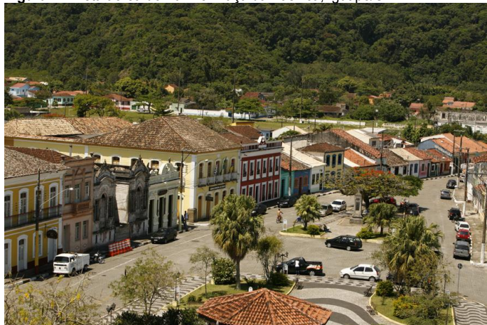
Figura 4 - Vista aérea do Funil e Praça da Basílica, Iguape/SP.

A partir do conceito de cidade-documento, entendeu-se que os processos históricos de formação urbana de Iguape eram o ponto de partida para o estudo de seus bens materiais, quer edificadas, quer naturais. As edificações em si, informadas simplesmente por seu valor para a historiografia da arquitetura, não interessavam à proteção proposta. O centro histórico de Iguape foi entendido e estudado no âmbito dos processos históricos formadores da sua materialidade. O que significa dizer que, ao se pensar na materialidade urbana de Iguape atentou-se com muito interesse para as inúmeras sobreposições e rearranjos espaciais constituídos ao longo de muitas décadas, entendendo até mesmo a proteção pelo Condephaat como um dos momentos da história da cidade. As representações históricas de diversos momentos eram a parte evidente de sua feição atual e só teria sentido fazer a proteção legal da cidade, tal como ela havia chegado até o momento presente. Era essa cidade, com seu sítio, seu arruamento e suas edificações e espaços livres que compunham os sentidos identitários, sociais e históricos dos que a habitavam e que assegurariam sua permanência tanto física, quanto simbólica. (Figura 4)