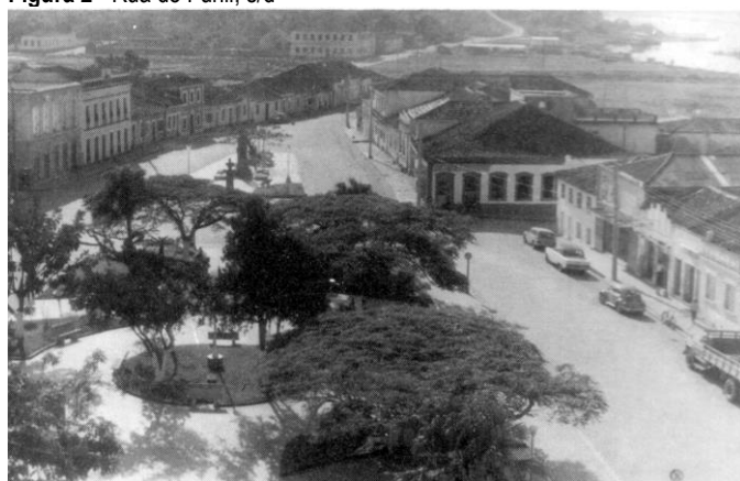
Figura 2 - Rua do Funil, s/d