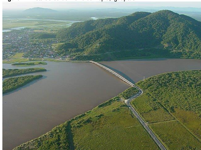
Figura 7 - Vista aérea do Morro da Espia, Iguape/SP.

Reconhecendo as íntimas relações entre o morro, a pedra, a fonte e a história de Iguape, a proposta de tombamento tratou de incluir este importante elemento formador, estendendo o perímetro do Centro Histórico de Iguape, incorporando-o como um setor específico da área tombada: o Setor Morro da Espia (Figura 7).