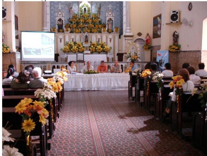
Figura 3 - I Encontro de Trabalho do Patrimônio Cultural no Vale do Ribeira, realizado na Igreja de São Benedito em Iguape/SP em junho de 2008. Promovido pela equipe técnica do projeto como parte das atividades de conversa com a comunidade local e institucional envolvida com tema no Vale, reunindo prefeitos, diretores de parque, técnicos de patrimônio, pesquisadores, professores e movimentos sociais

O pedido de tombamento ao Iphan informava da importância do patrimônio cultural para a identidade da cidade de Iguape. Os fortes vínculos culturais dos moradores com a localidade, seja nos aspectos materiais ou sociais revelava que, se experiência com a proteção legal era penosa, ela não era negada. Ou seja, a aproximação pronta e colaborativa com o Iphan por parte dos moradores e gestores reforçava a importância do patrimônio para aquela comunidade. O estudo de tombamento iniciou-se a partir da formalização do pedido da municipalidade ao Iphan, que passou a trabalhar estreitamente com os funcionários da prefeitura, considerando a produção já elaborada até o momento, bem como as suas demandas para a proteção legal. A municipalidade esteve envolvida o tempo todo no processo de elaboração do Dossiê de tombamento, ajudando com documentos, informações, logística e inclusive hospedagem para toda a equipe envolvida no projeto.