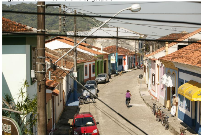
Figura 5 - Rua XV de Novembro, Iguape/SP.

A política do Iphan assinalava a potencialidade do patrimônio e das políticas de preservação para o desenvolvimento local, relacionando os sentimentos locais e singulares de autoestima e pertencimento, abrindo-se a possibilidade de proteção em nível federal de inúmeros imóveis e centros urbanos nuançando posicionamentos históricos da instituição. (NASCIMENTO, 2011) O tombamento de Iguape é indissociável deste momento institucional dos anos 2000. A abordagem regional do estudo e a escolha do Vale do Ribeira como área de atuação para o Iphan coadunava com a ideia em curso do patrimônio com maior capilaridade na atuação do órgão, incorporando à listagem de bens tombados uma série de bens culturais que não haviam sido selecionados até o momento pelo Iphan (Figura 5).