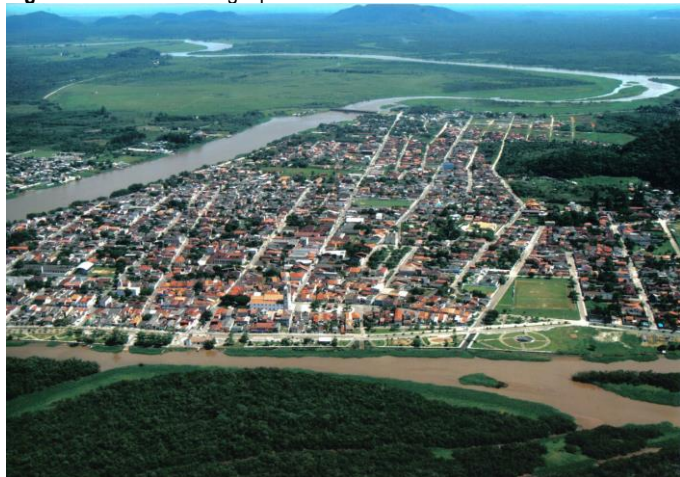
Figura 6 - Vista área de Iguape/SP.

Situada entre importantes marcos referenciais da paisagem, o Morro da Espia, o Canal do Valo Grande e o braço de mar chamado Mar Pequeno, Iguape caracteriza-se por ser plana e composta por importantes casas e sobrados de pedra e cal, com coberturas de telha de barro. Tombar somente as construções significaria apartar da compreensão de sua formação histórica esses elementos e as relações tecidas com a natureza. O estudo buscou, assim, conceber o sítio urbano a partir das relações tecidas com o sítio natural (Figura 6).